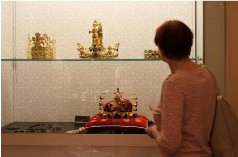
Z výstavy Klenoty a šperky králů v Kutné Hoře.

Na přední straně: Koruna Lombardského království, kterou byl korunován Karel IV. v roce 1365 na cestě do Říma ke korunovaci za římského krále.